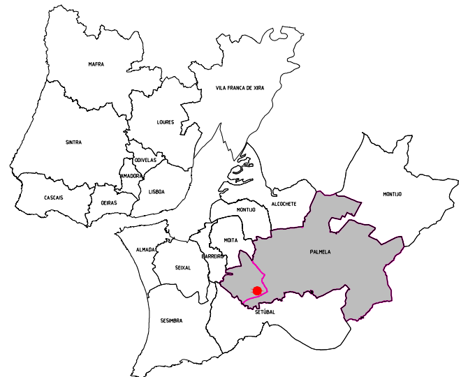
Localização na Área Metropolitana de Lisboa