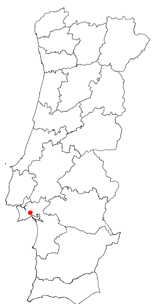
Localização no território continental

Enquadramento territorial